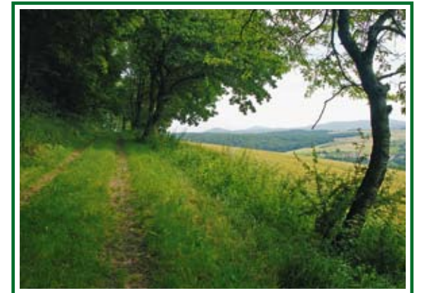
Weg entlang Kleinberg